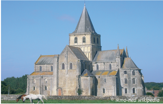
Abbaye de Cerisy-la-Forêt

Cette randonnée fait partie d'une série de 5 randonnées permanentes qui vous feront découvrir le marais côtier et les vallées qui composent le parc naturel régional des Marais du Cotentin et du Bessin :