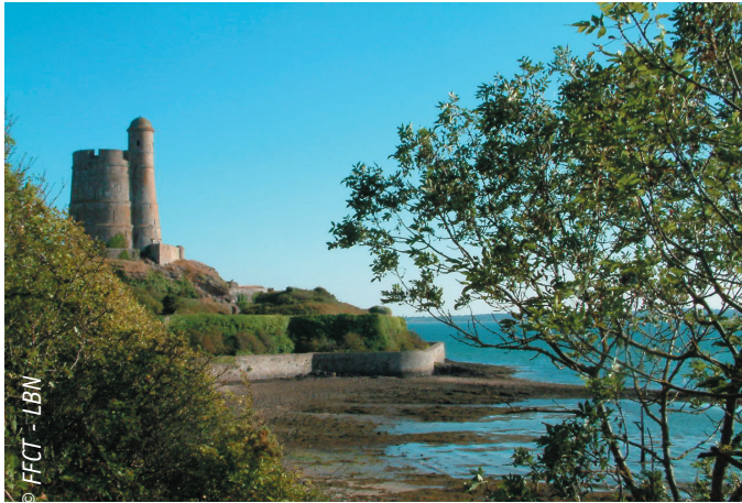
Fort de la Hougue

Cette randonnée fait partie d'une série de 5 randonnées permanentes qui vous feront découvrir le marais côtier et les vallées qui composent le parc naturel régional des Marais du Cotentin et du Bessin :