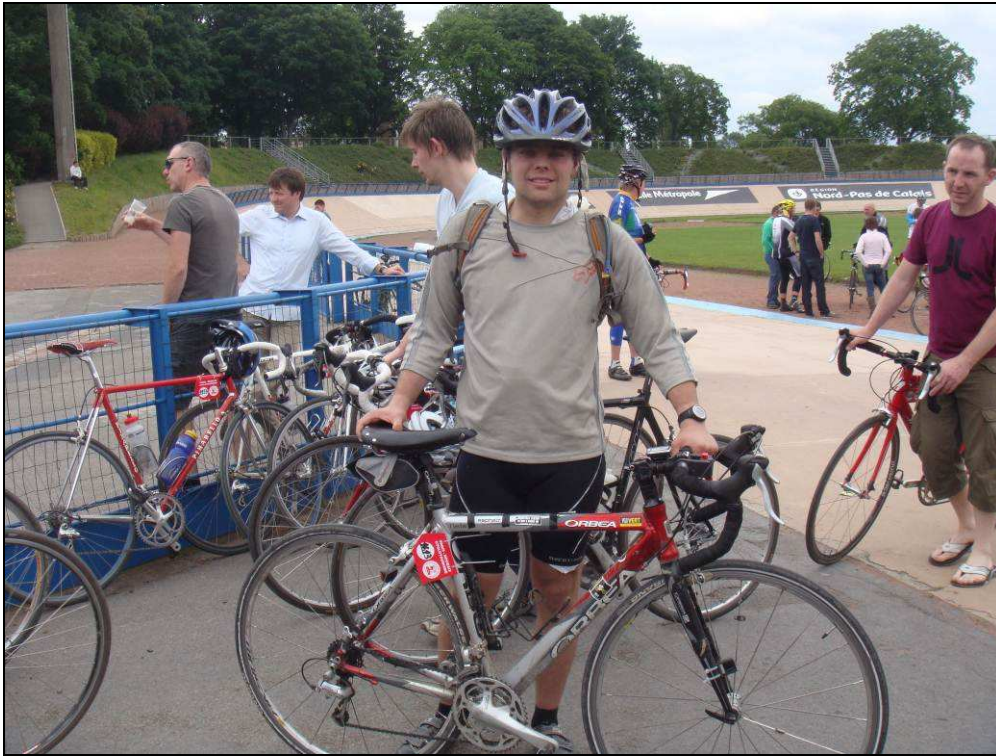
Terminus. Le vélodrome de Roubaix après deux tours de piste.