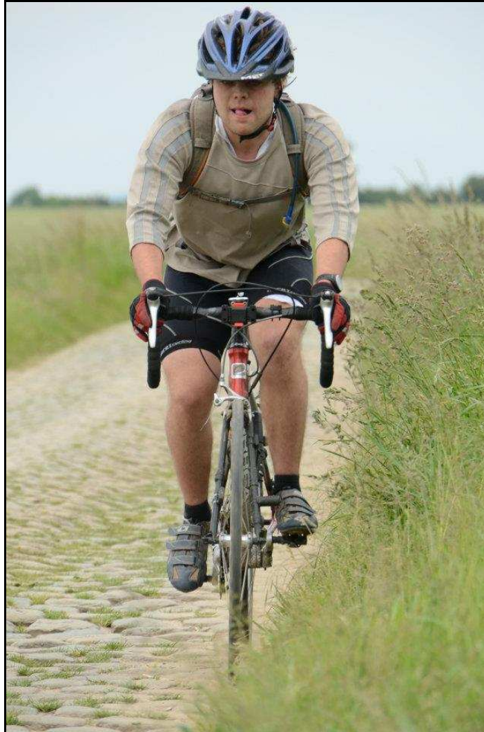
La fin du secteur de l'Arbre, soit la partie la plus facile

La vue du restaurant de l'Arbre, tout au bout de la ligne droite, fait un peu oublier les douleurs en sachant que la délivrance est proche. Je commence enfin à voir le bout de mon périple et je peux profiter du public venu en nombre pour encourager leur poulain dans la dernière centaine de mètres de cet endroit mythique où se joue souvent la victoire dans la course professionnelle.