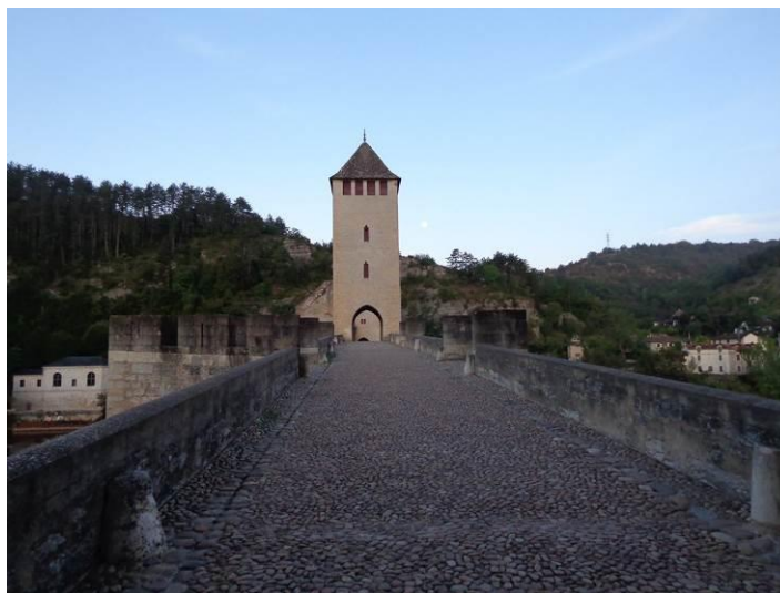
Le Pont Valentré à Cahors