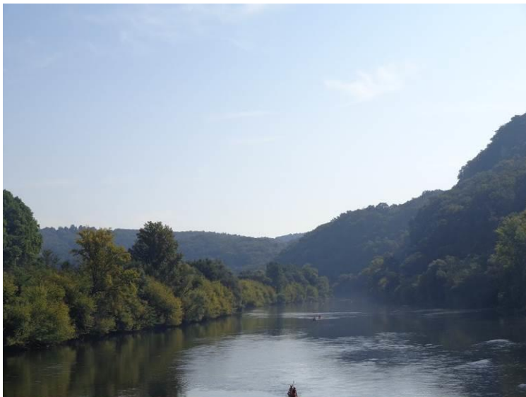
La Dordogne au pied de Domme, à Cénac