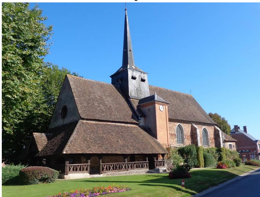
L'église de Souvigny-en-Sologne et son Caquetoire. A droite, le bistrot