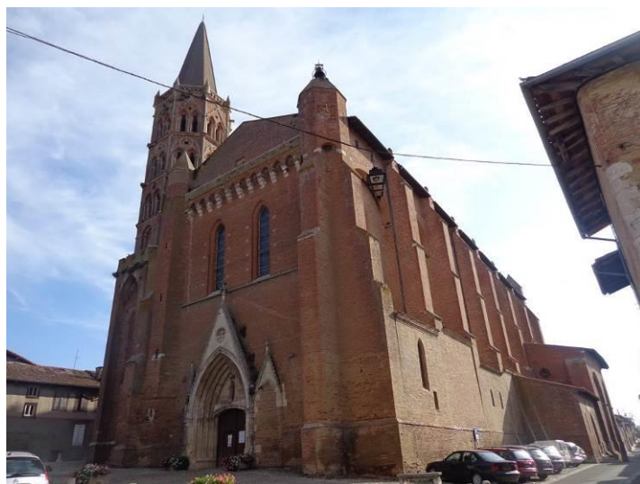
Les halles et l'église de Beaumont en Lomagne