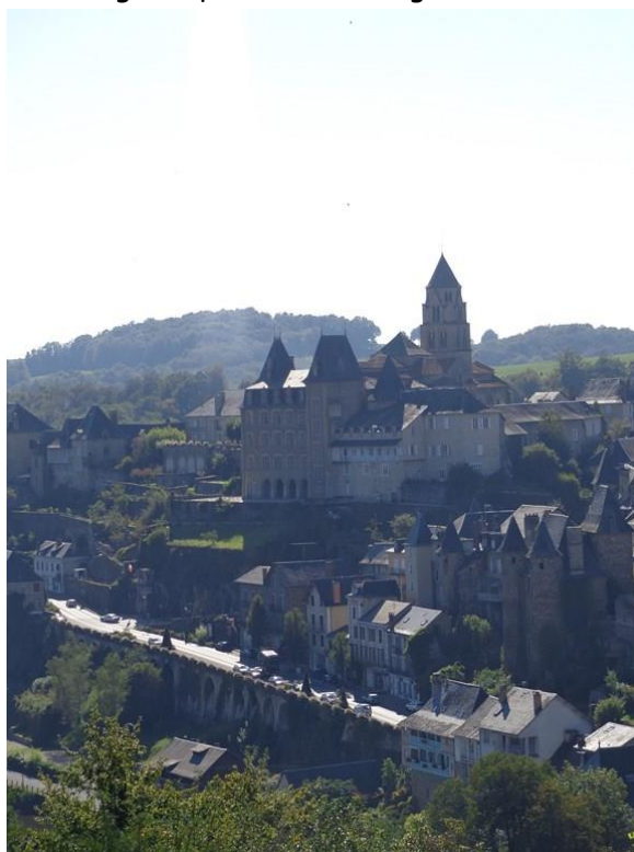
Uzerche (Corrèze), sur les rives de la Vézère (3 ème traversée du jour). Terre de Président.