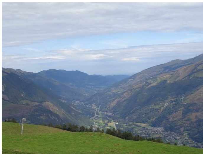
Bagnères de Luchon vu depuis la montée de Superbagnères