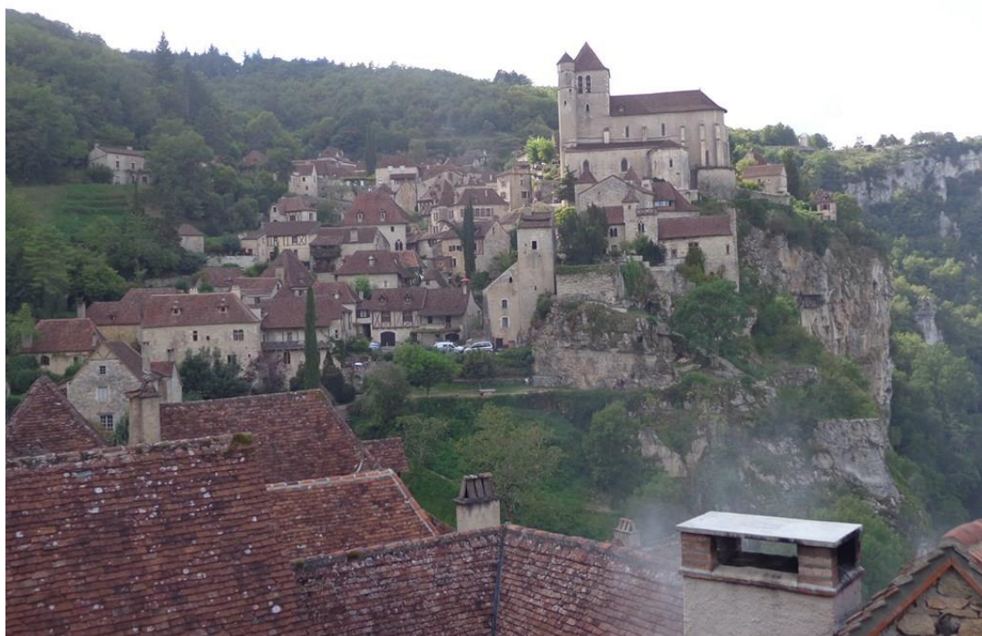
Saint-Cirq-Lapopie sur son éperon rocheux dominant le Lot. Un nouveau superbe BCN/BPF