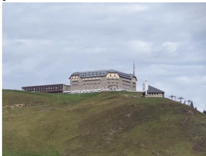
La grand Budapest hôtel de Superbagnères.