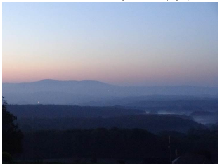
Du côté de Sourdoux. Partage des eaux Garonne / Loire