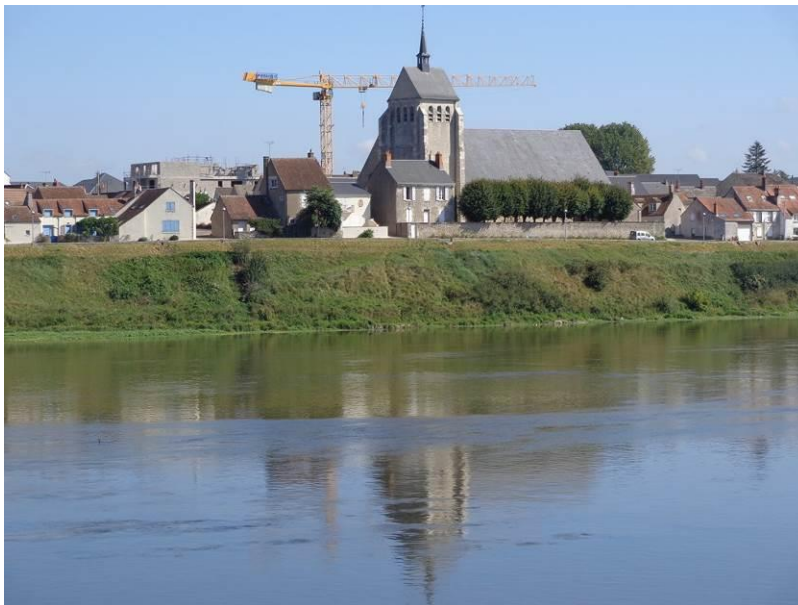
Saint-Denis-de-l'Hôtel, en face de Jargeau, sur la rive droite de la Loire.