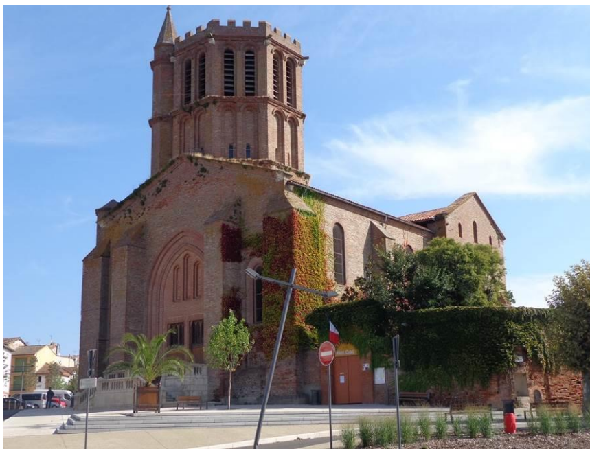
L'église de Castelsarasin