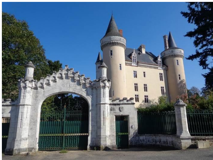
Le château de Saint-Chartier.