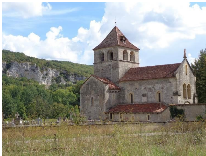
Chapelle Notre-Dame-de-Velles sur le bord du Lot.