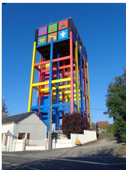
Le château d'eau, visible de loin, à l'entrée d'Issoudun