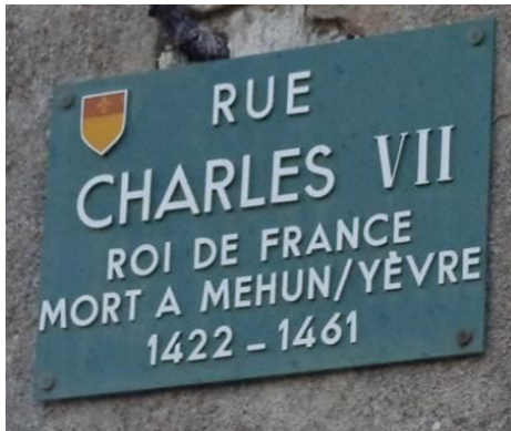
L'intérêt de la commune est le château de Charles VII