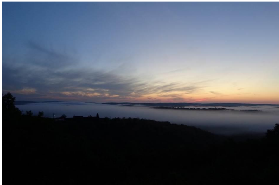
La vallée du Trouboulou sous la brume laiteuse.