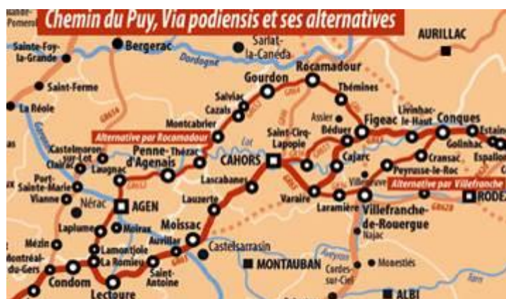
Saint-Cirq-Lapopie est sur la route de Saint de Compostelle depuis le Puy-en-Velay. Comme Moissac, Lauzerte et Cahors.