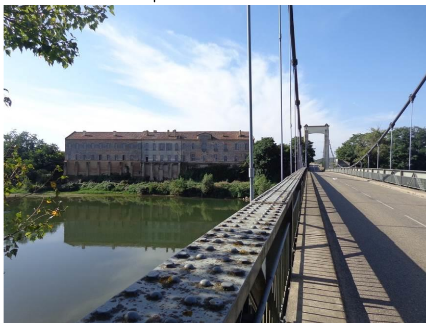
Passage de la Garonne (avant la confluence la Gimone) au niveau de l'abbaye de Belleperche. Le pont tremble sous le passage des camions.