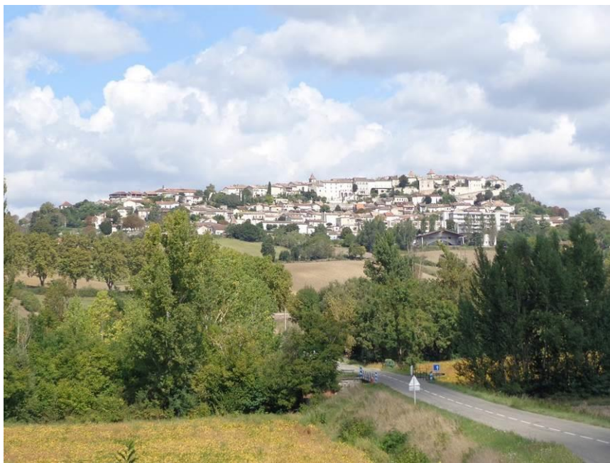
Lauzerte, ville fortifiée sur sa colline. BPF du Tarn-et-Garonne et lieux de passage des chemins de Saint-Jacques