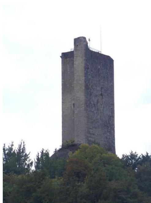
Sur la route de Cahors