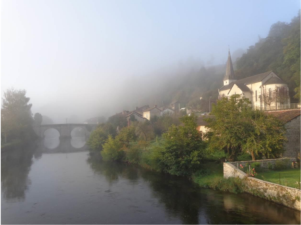
Saint-Léonard de Noblat. Village natale de Monsieur Raymond Poulidor

Détours pour une belle cueillette de BCN/BPF