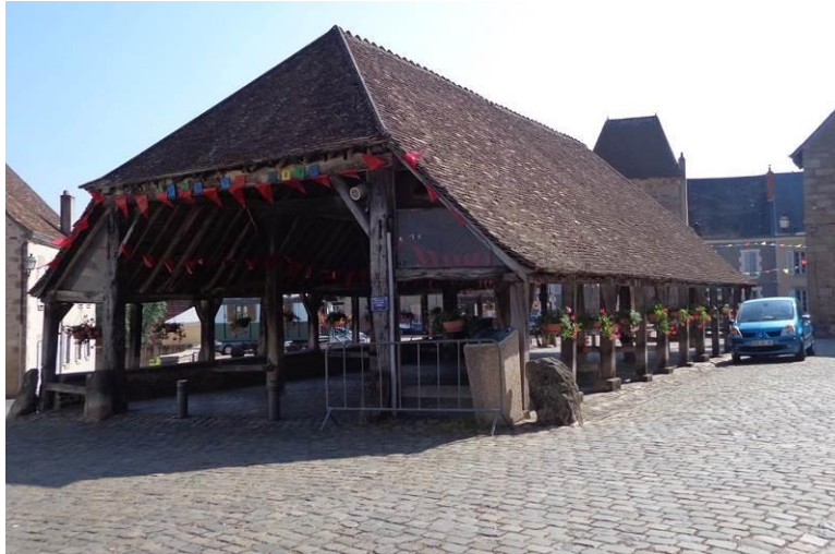
Les halles de Ste-Sévère-sur-Indre. BPF / BCN de l'Indre (36). Ne l'ayant pas vu, je n'épiloguerai pas sur « Jour de Fête ».