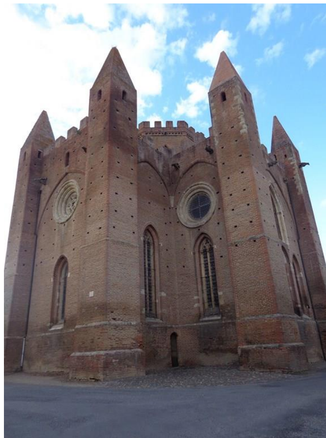
Sur ces trois photos, l'église fortifiée de Simorre (Gers)