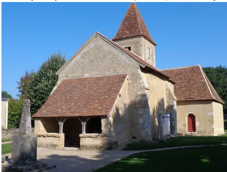
La petite église de Nohant-Vic