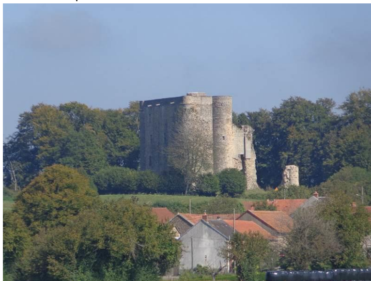
Le château de Montaigut-le-Blanc. Une quinzaine de kilomètres avant Guéret.