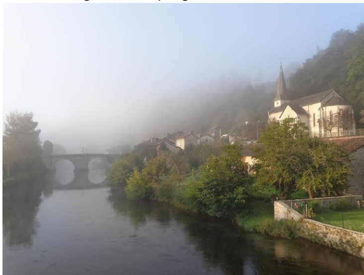
La Vienne avant d'arriver à Saint-Léonard-de-Noblat