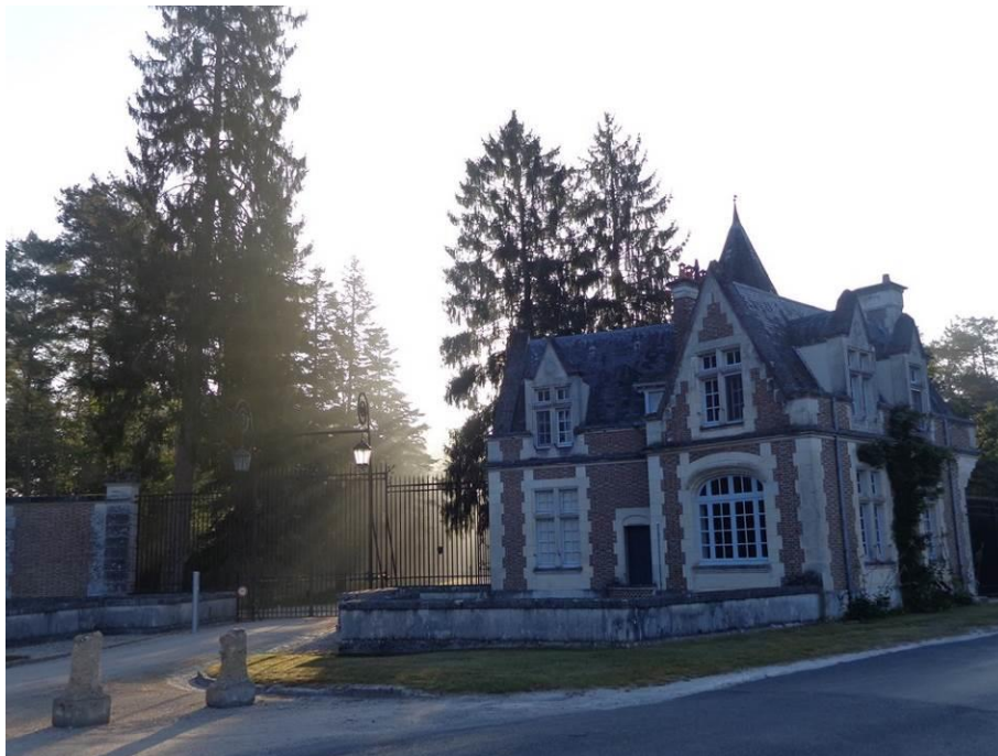
L'entrée du Château de Vouzeron