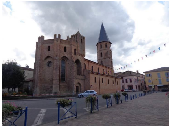
L'église fortifiée de l'Isle en Dodon