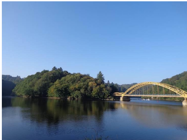
Le pont du Dognon, sur la rivière le Taurion, au niveau de la retenue d'eau du barrage de Saint-Marc