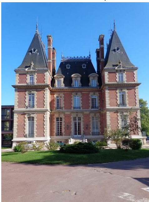
Maison de retraite en région parisienne