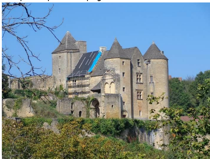
Le château de Salignac-Eyvigues