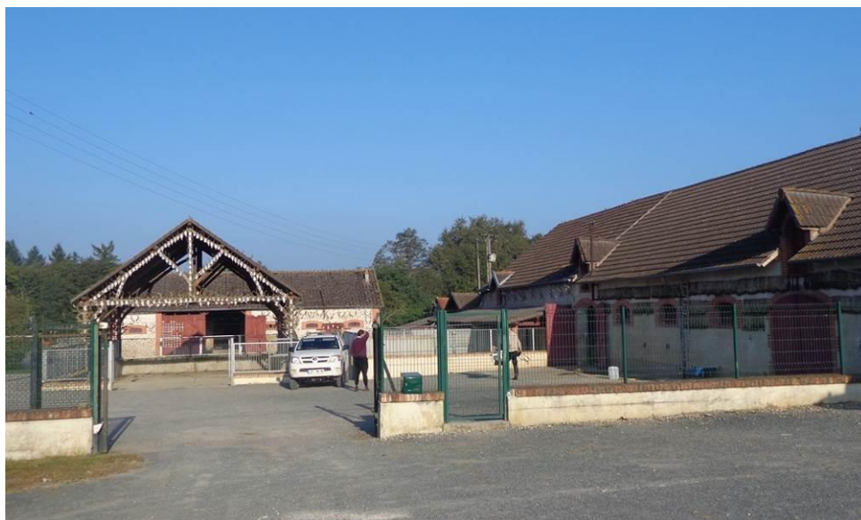
La propriété de chasse. Bâtiment de droite destiné à la meute de chien. Dans le fond, le garage. A gauche (non visible), les écuries. Au centre, sur la ferme du bâtiment, les trophées de chasses.

chasse où les deux employés vont faire gambader les chevaux et les chiens. Ça respire la France d'en haut.