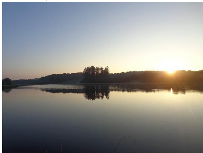
Etang de Servignat. A la sortie de Linards